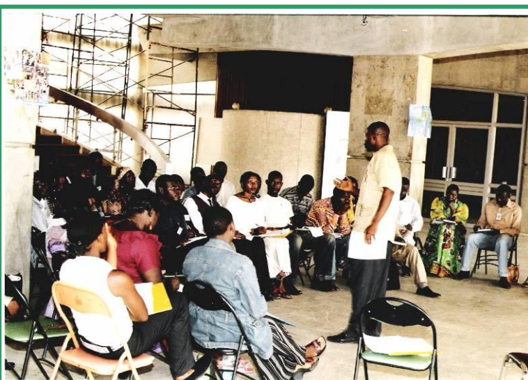
Présentation des jeunes séminaristes en plénière