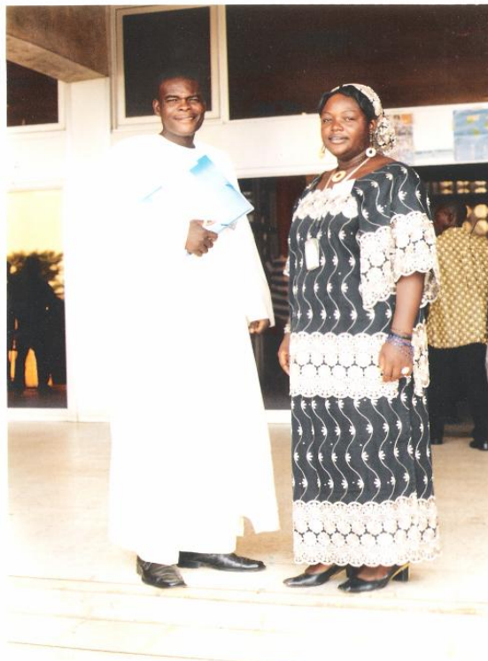
Les deux représentants des jeunes leaders d'associations de la province de l'Extrême - Nord