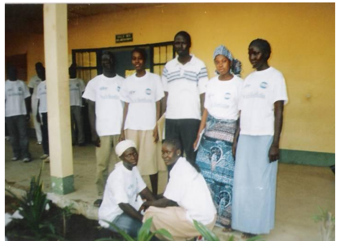
Membres des Clubs du Lycée de Maga et Taïbong