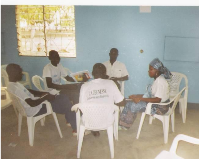
Travaux en atelier de du groupe 3