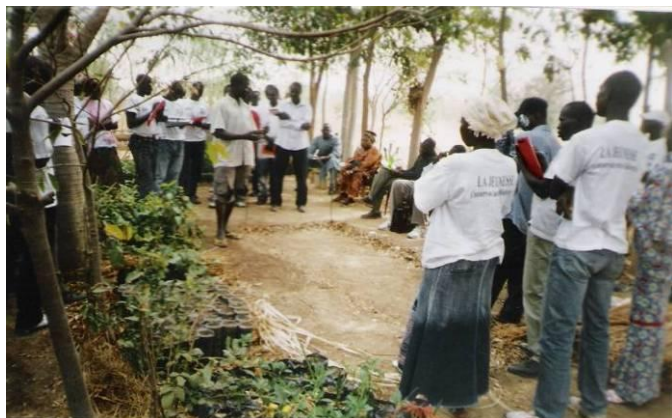
Explication sur les techniques de production des plants en pépinière par le pépiniériste