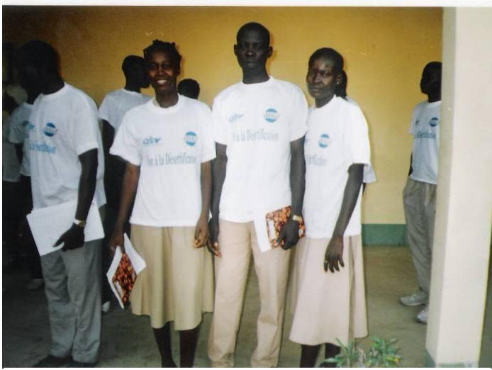
Quelques membres du Club du Lycée Bilingue de Yagoua