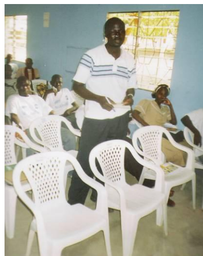
Restitution des travaux en plénière du groupe 1