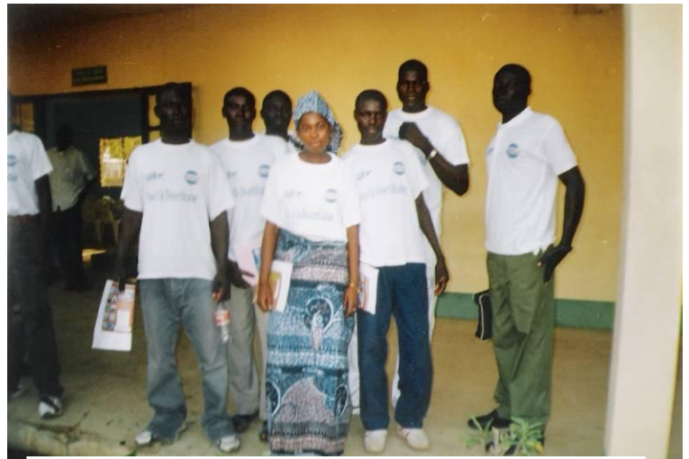
Membres des Clubs du Lycée de Doukoula et de Taïbong