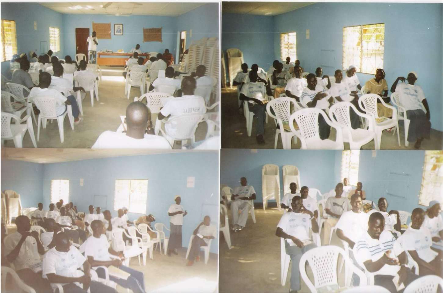
Présentation des séminaristes en plénière