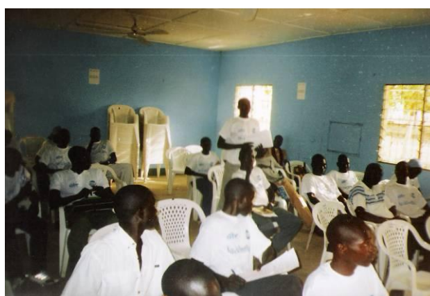
Restitution des travaux en plénière du groupe 2