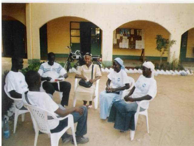
Travaux en atelier de du groupe 1