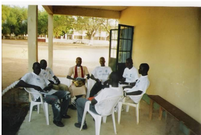
Travaux en atelier de du groupe 2