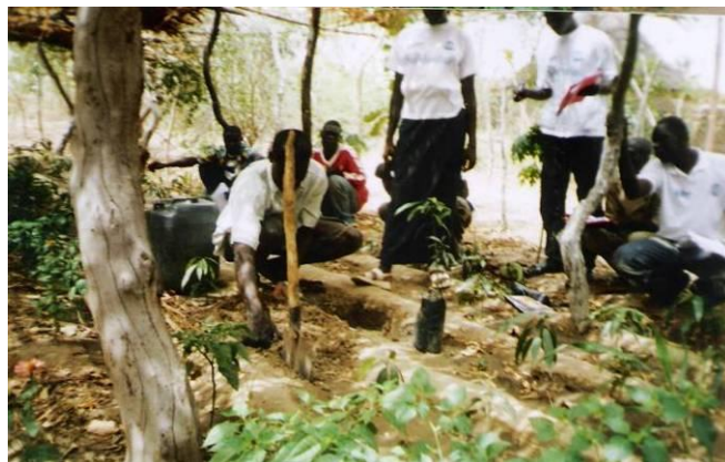
Séance de démonstration de mise en terre d'un plant par le sylviculteur WAACHING