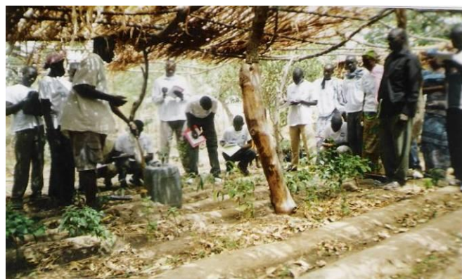
Démonstration de la trouaison pour un plant forestier par le sylviculteur