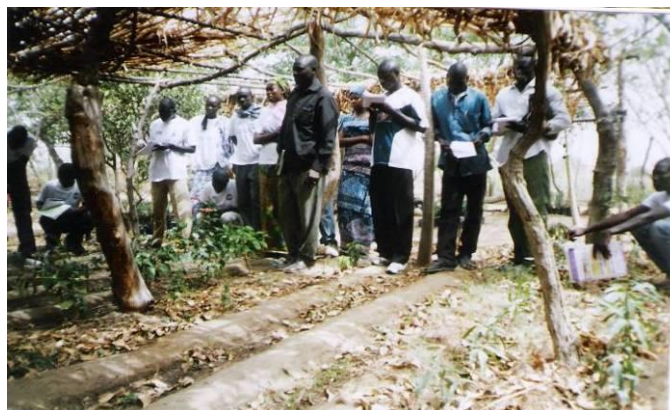
Entretien des jeunes sur les noms scientifiques des arbres