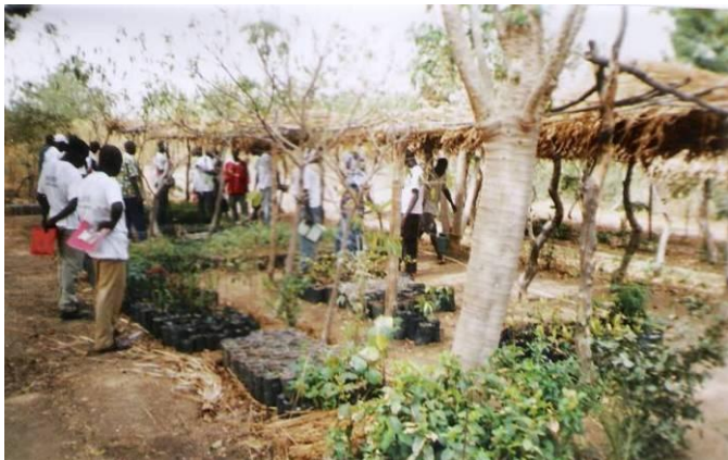
Présentation de la pépinière aux jeunes

Après lecture du rapport de la deuxième journée par le jeune DJAOYANG du Lycée de Dziguilao, les jeunes participants ont été conduits dans la pépinière privée de M WAASCHING. Les enseignements présentés aux jeunes sont illustrés par les images commentées ci – dessous :