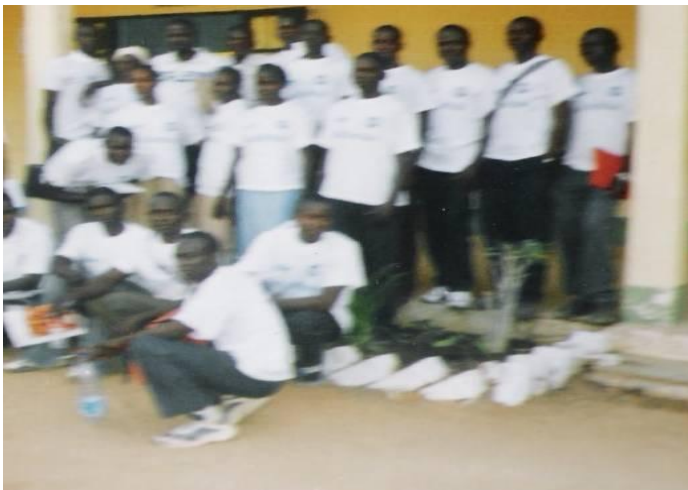
Membres des Clubs des Lycées Technique, Bilingue et Classique de Yagoua