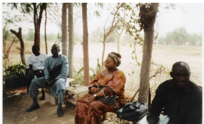
Supervision des travaux par le délégué départemental du MINEP du Mayo Danay et de l'Administrateur ABIOGeT