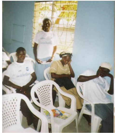
Restitution des travaux en plénière du groupe 3