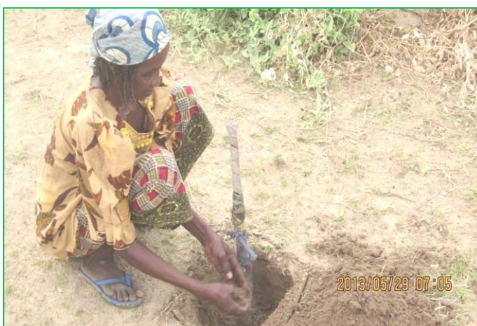
Fanne creuse les trous de plantation