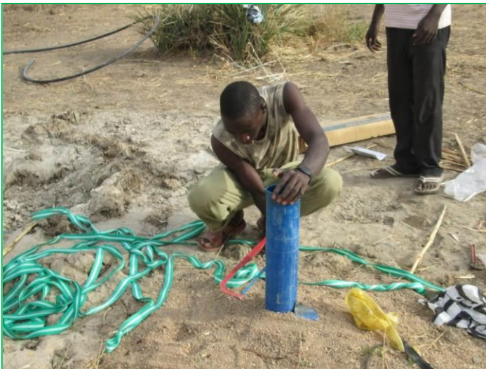
Forage en installation

L'eau est une ressource très rare à Karabiwa. La grande difficulté que nous avons rencontrée est le manque d'eau souterraine ni sur le site de plantation, ni même à proximité du village. Finalement, le forage a été installé à 1650 mètres de la plantation. Le forage est équipé d'une pompe immergée et d'un groupe électrogène pour son alimentation.