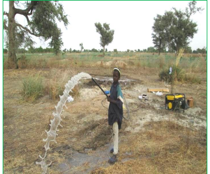
Les essais de pompage de l'eau