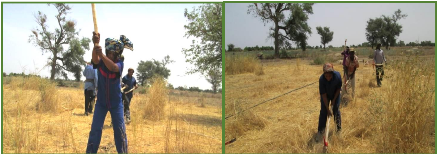
Les deux stagiaires creusant la canalisation vers Karawiwa