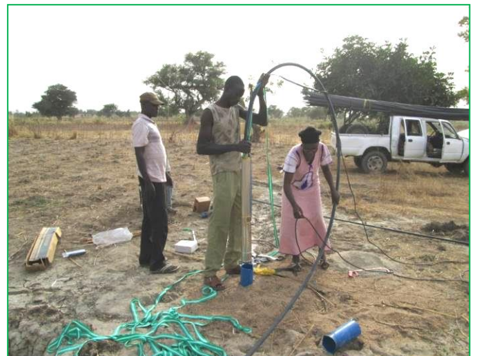
Installation de la pompe à immersion