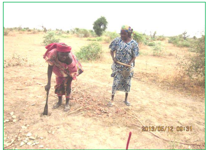
Défrichage et piquetage: les femmes du village au commande du projet