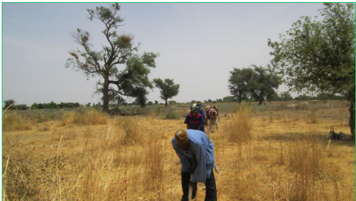
Creusage du canal de drainage