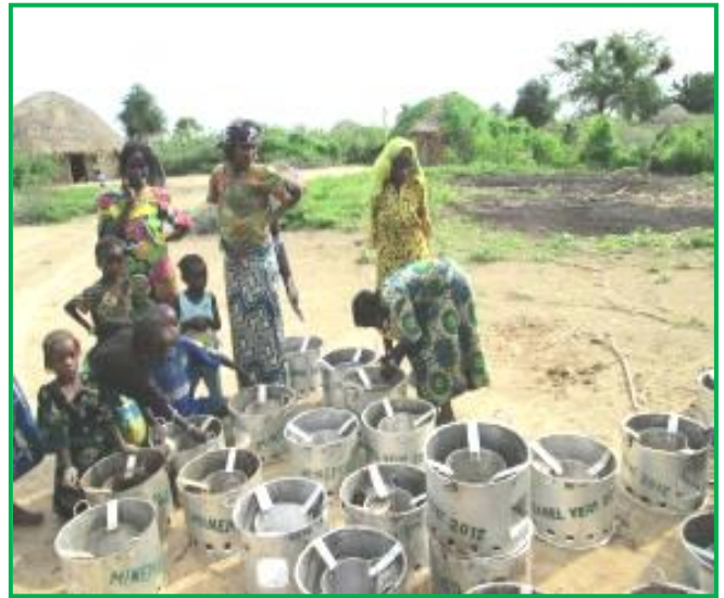
Distribution des foyers améliorés Bangui aux femmes de Karabiwa