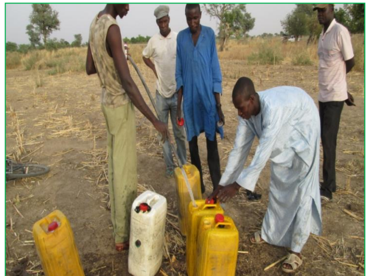
Population commence à puiser de l'eau pour arroser les plants et pour boire