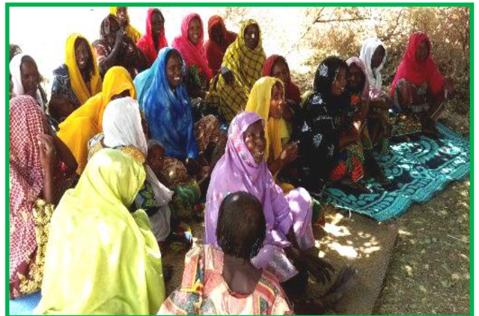
The women participated in the awareness meeting.