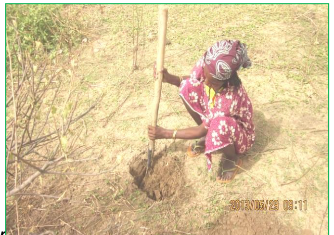
Ngoudja creuse les trous de plantation