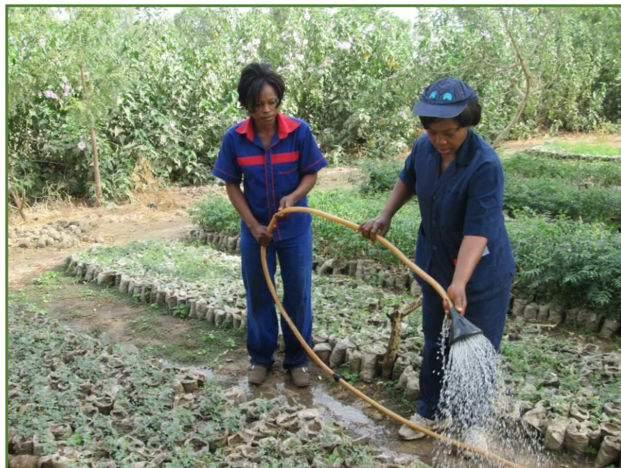
Les deux stagiaires au travail dans la pépinière