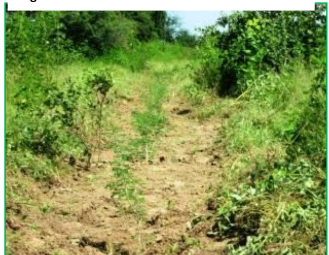
Ligne plantation (Acacia senegal)