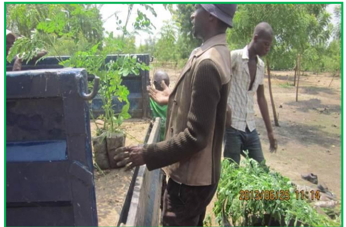
Chargement des plants dans le camion