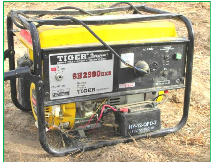
Groupe électrogène pour le forage