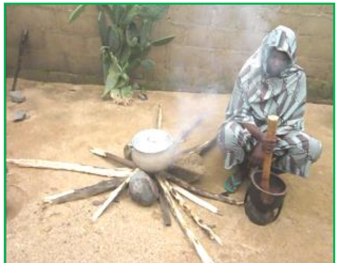
Foyer traditionnel à « trois pierres »