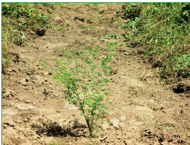
Plant d'Acacia senegal