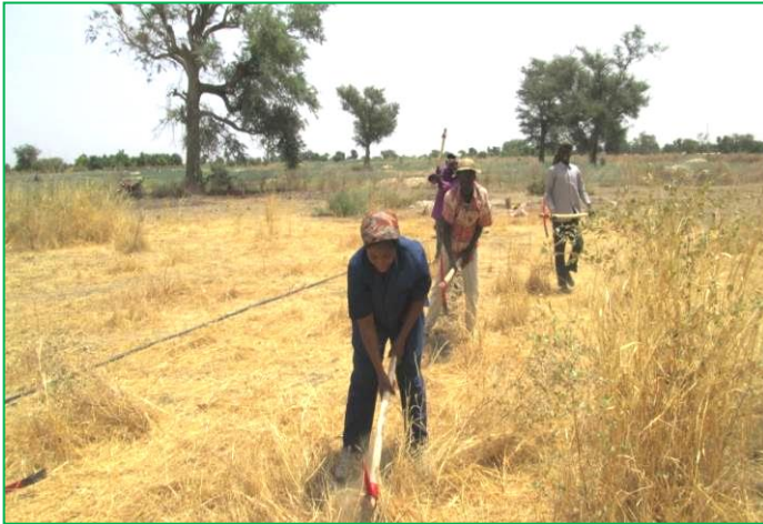
Creusage du canal de drainage

Pour drainer l'eau du forage jusqu'à la plantation, d'une part, et la rapprocher du village d'autre part, ABIOGeT a proposé aux villageois de creuser une canalisation. Un montant de $1 500 a donc été collecté par les membres d'ABIOGeT pour d'acheter 275 tuyaux de 6 m et les matériels accessoires. La main d'œuvre des villageois pour creuser le canal est estimée à $500. La distance à réduire dans un premier temps est de 1 650 mètres. A cause du sol qui est très endurci pendant cette période de saison sèche, les travaux de creusage avancent lentement mais sûrement, ce qui veut dire que l'installation du canal de drainage n'est pas encore finalisée. Les photos qui suivent montrent les travaux.