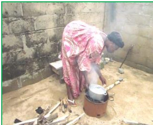
Foyer amélioré de Bangui