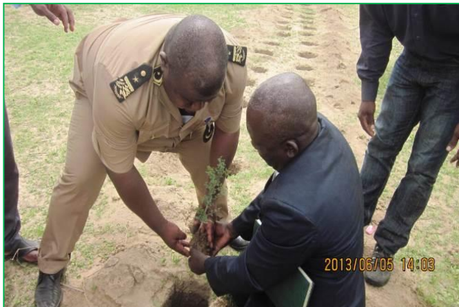
Le sous-préfet Pierre Migne en train de planter le 1er arbre sur le site de plantation.