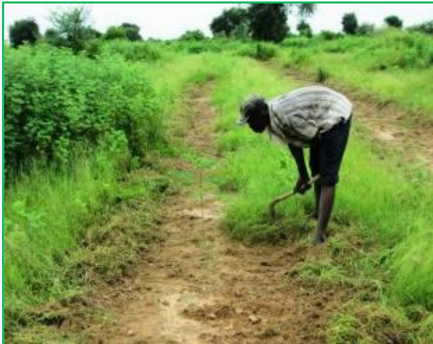
Moussa Boki pendant l'activité de désherbage