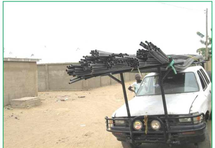
Transport des tuyaux de canalisation