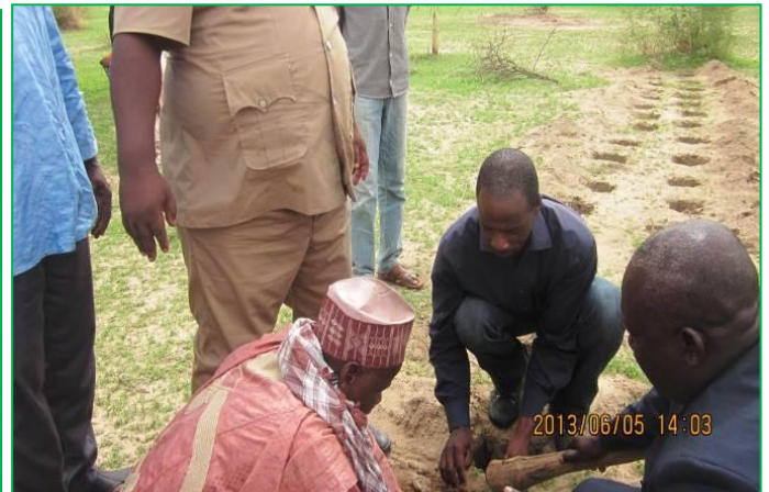
Le chef de canton sa Majesté Dounoma en train de planter l'arbre sur le site de la plantation.